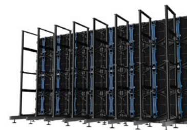
INSTALLATION SUR BASE